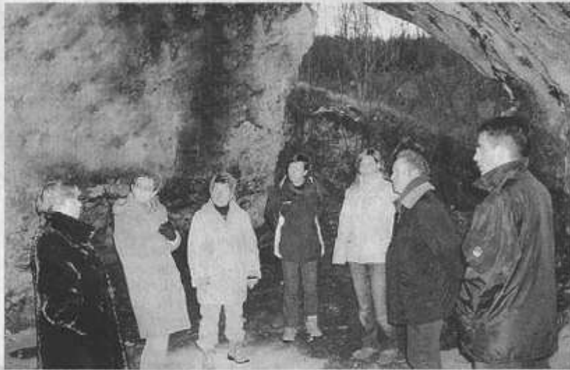
La grotte du Vogelherd dans le Bade-Wurtemberg où il y a 35 000 ans les Aurignaciens sculptaient dans l'ivoire de mammouth.